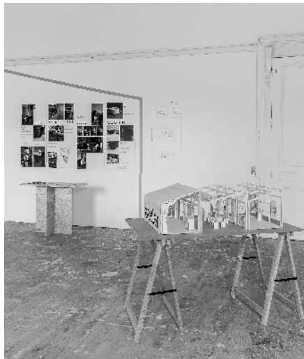
Clara Beaufrère, DNSEP Design 2023