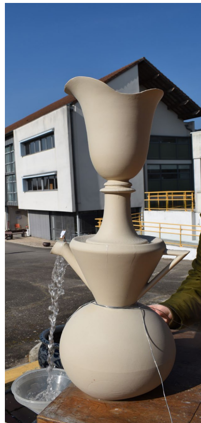
Résidence lycée Henry Moisand à Longchamp © Rosalie Piras 2023

Les grands axes de la résidence sont le partage, la transmission, l'exposition.