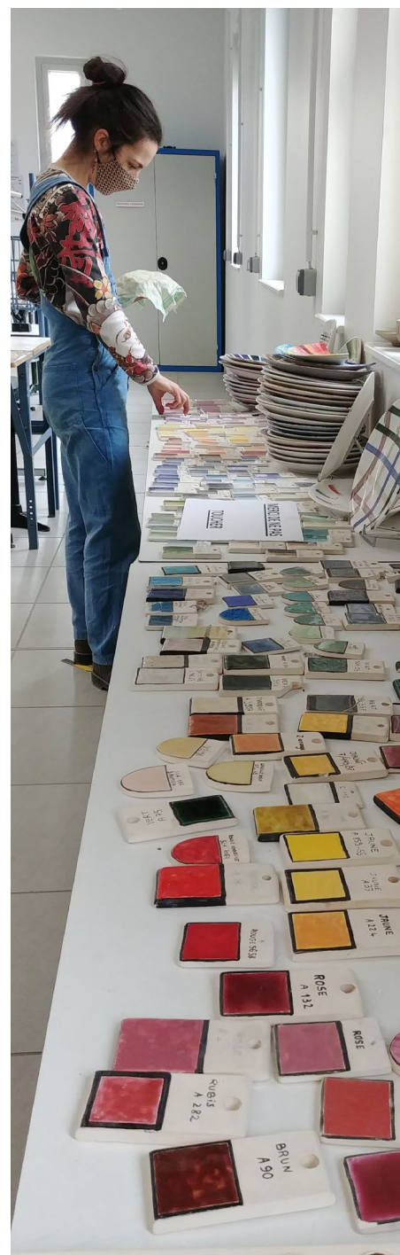
Résidence lycée Henry Moisan à Longchamp

L'artiste conçoit le projet d'exposition et le workshop, dans l'échange avec les personnalités référentes du projet au sein du lycée. Il/elle se met éventuellement en relation avec des structures partenaires pertinentes. Les moyens techniques mobilisés sont ceux du lycée qui produit l'exposition.